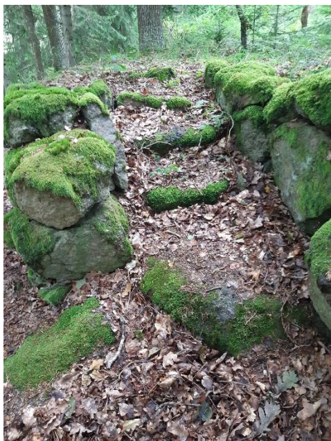
Trappan upp till plattformen