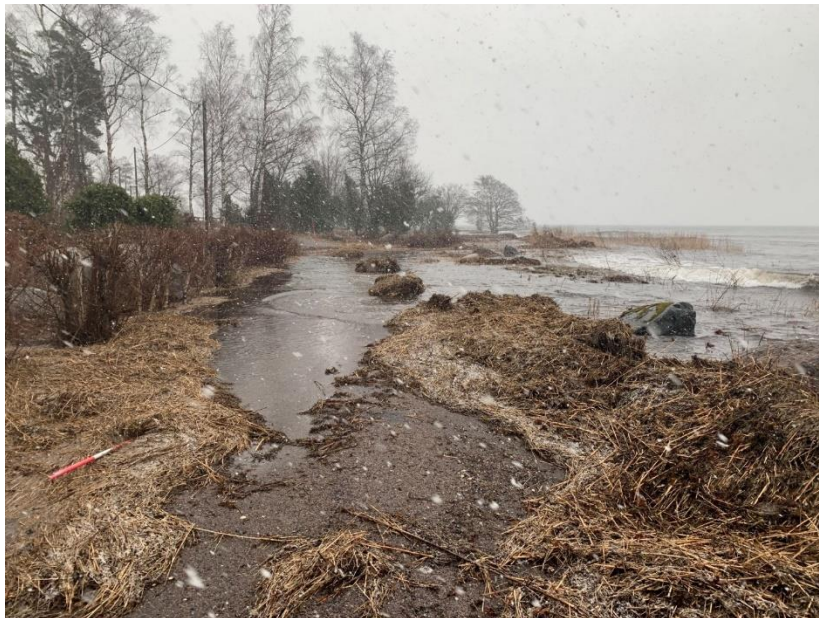
Uddängsvägen 28 februari 2020. Här krävdes insats av plog för att återställa vägen