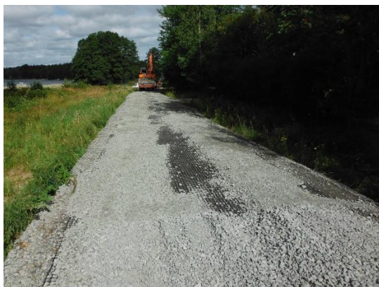
Vägarna byggdes upp igen och förstärktes med kraftigt nät.