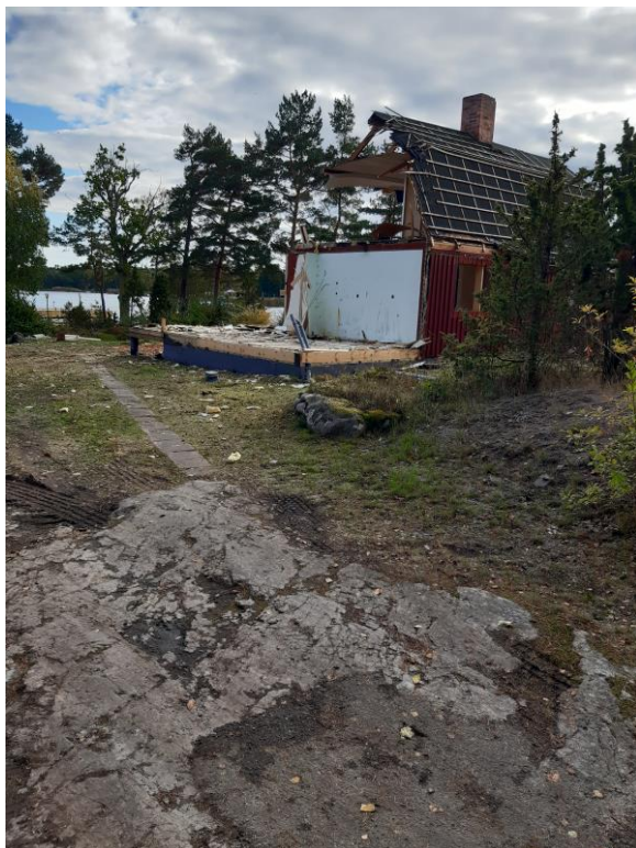
Bilder från rivningen oktober 2020