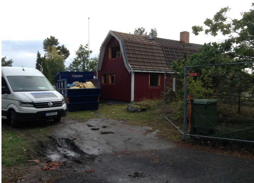
Bilder från rivningen oktober 2020