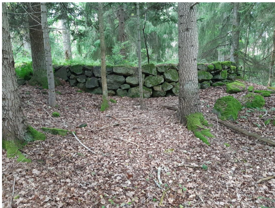
Observationsplatsen, sakta återtar naturen