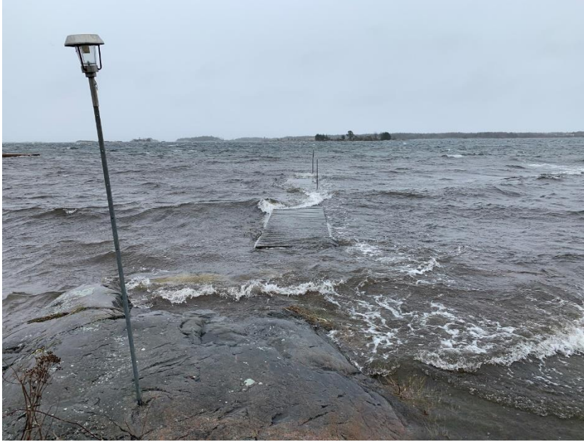
Översvämning vid Horns Udde 28 februari 2020.

Styrelsen kunde konstatera att år 2011 kommer att gå till historien som den värsta snövintern under föreningens historia. Det var mycket 1987 och 2010, men inte så mycket.... Styrelsen har under året 2012 testat snöstaket. Vi kan konstatera att det hjälper. Efter utvärdering genomfördes ytterligare inköp. Under de senaste åren har vintrarna varit mycket korta eller helt uteblivit. Dock har höga vattenstånd tillsammans med mycket hårda vindar förorsakat skador på bryggor och vägar.