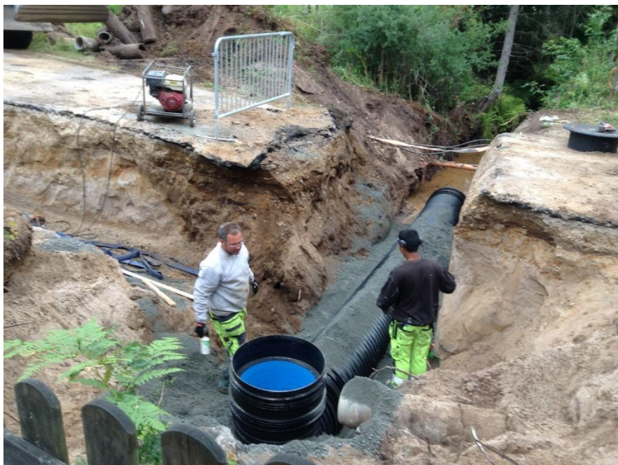
På Lindödjupsvägen finns en bäck som korsar vägen. Rörledningen under vägen var helt krossad så en ny trumma lades ned i samband med framgrävning av VA-ledning.