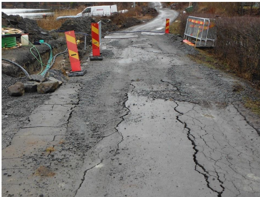
Under VA-arbeten och byggnationer brast vägen pga. tunga transporter.