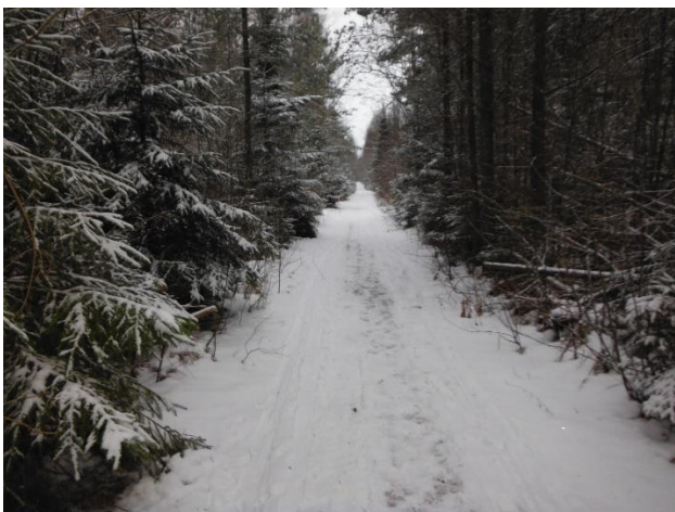
Linneastigen även kallad "fula vägen" före avverkning. Bilden togs 24 januari 2016.