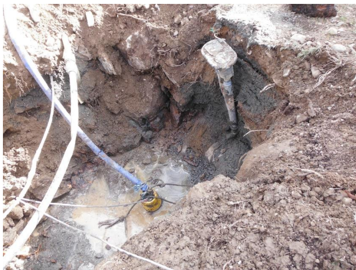
Surhål i Målängen

Åren 2000-2020 får anses lyckade för samfällighetens medlemmar trots alla fallgropar och surhål.