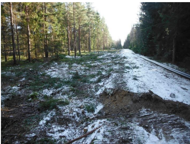
Skogsavverkning för VA på Linneastigen är genomförd. Ihopsvetsat rör för VA ligger redan i kanten.