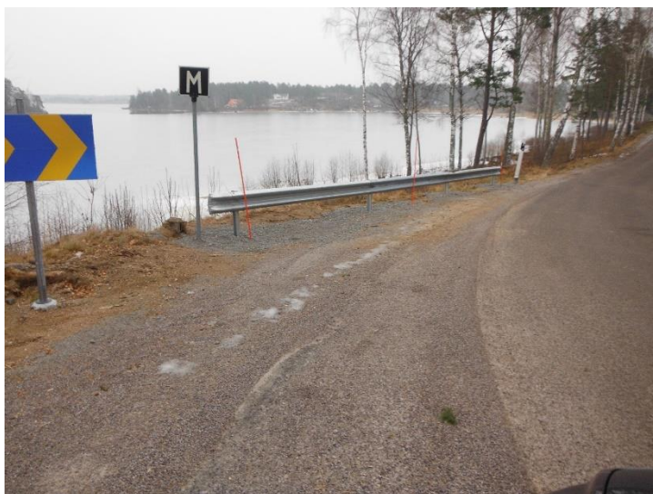
Vägskydd monterades 3 februari 2017.

En utredning om att Samfälligheten eventuellt skulle ta över stickvägarna inom gemensamhetsområdet påbörjades 2018. Resultatet innebär att vägar kommer att övertas av samfälligheten först efter att en lantmäteriförättning skett. Kostnaden för detta kan bli mycket stor.